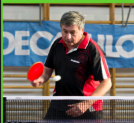
Klompár Tibor 2x világbajnok